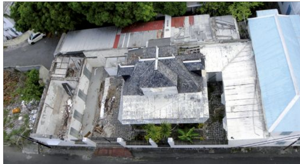
(Décembre 2013) Avant, en décembre 2013 lors du rachat...