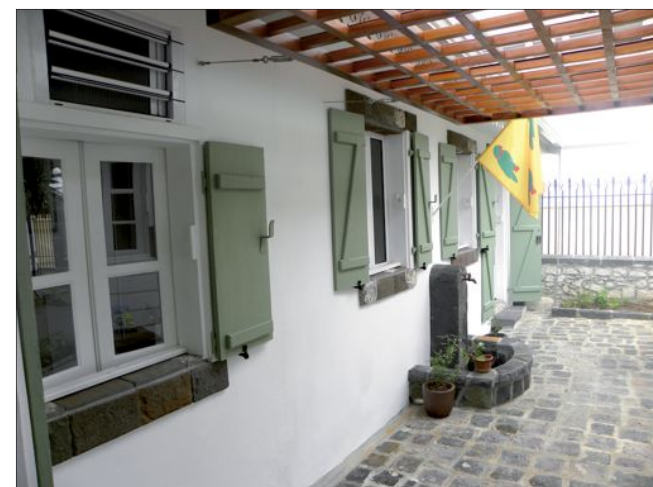
(juillet 2015) Cette fontaine ancienne a été retrouvée dans le pavage de la cour...