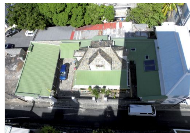
(Avril 2015)... après, en avril 2015 avec une toiture neuve aux intérieurs bois, couplés à une couverture en tôle et fibrociment...